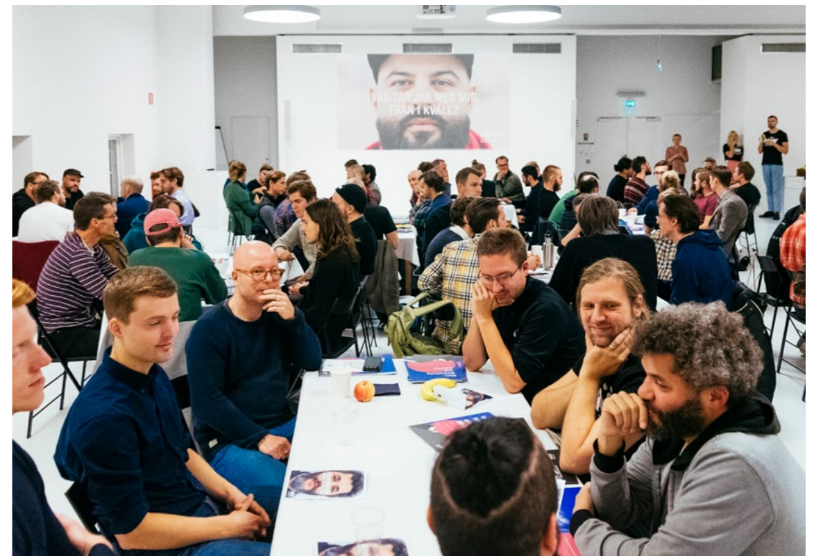
Till vårt stormöte på Färgfabriken i Stockholm kom 66 män. De fick chansen att både lyssna på andra och berätta om sina egna tankar och erfarenheter.