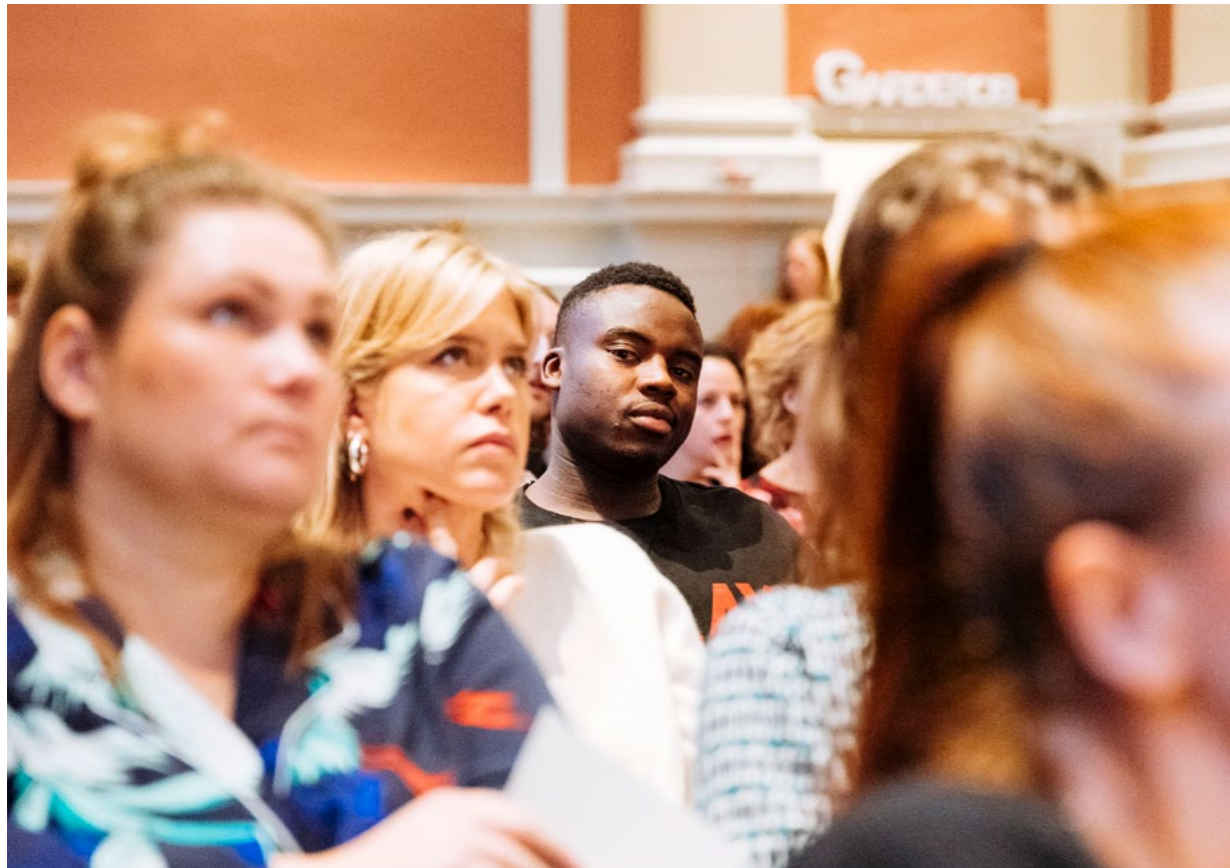
Intresset för konferensen var så stort att biljetterna tog slut, och det var många som istället kollade på vår direktsändning eller i efterhand på Youtube.