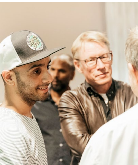
Under samtalsturnén använde vi oss av metoden Lilla rummet som är utvecklad av MÄN.

#metoo dominerade vår verksamhet under andra halvan av 2017 och en bra bit in på 2018, men vad hände efter #metoo? Gick det att ta tillvara på det engagemang och intresse för jämställdhet som skapades och ledde #metoo till en verklig förändring? Det var frågor vi ville få svar på under 2018.