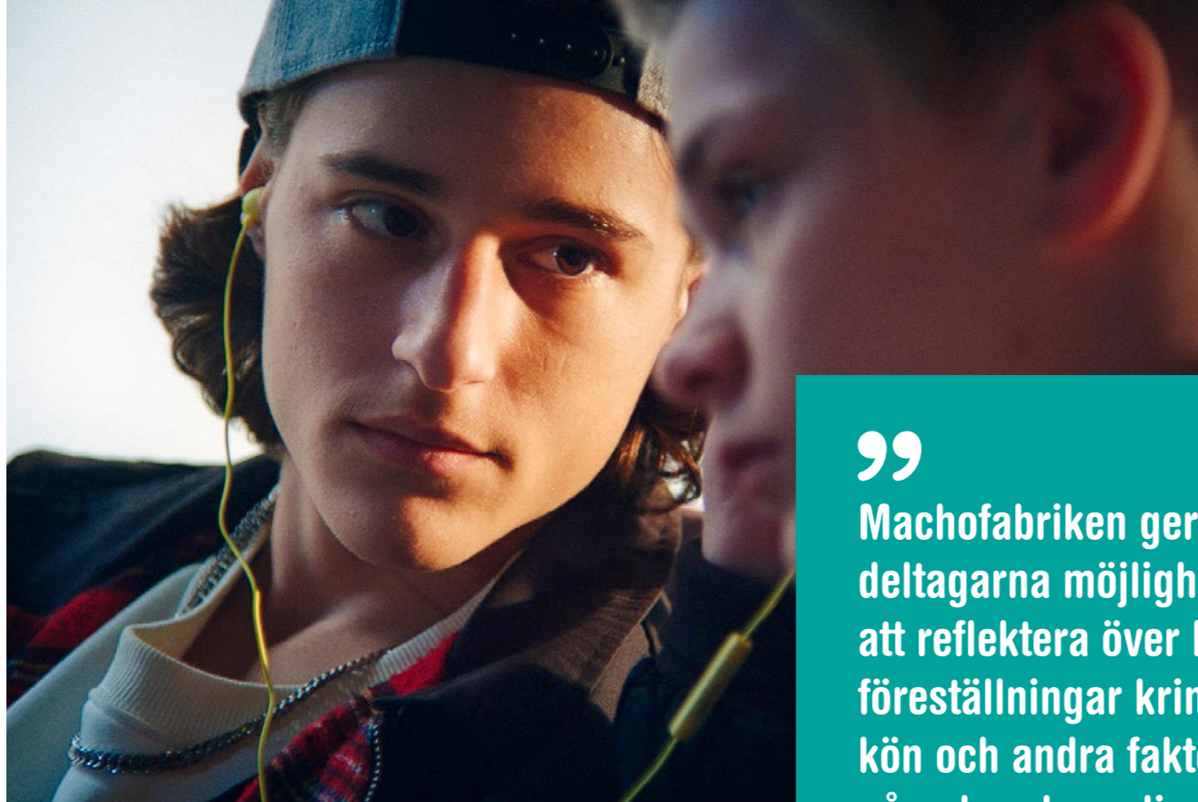
Bild från filmen "På bussen" – en del av Machofabriken's nya metodmaterial.

”Machofabriken ger deltagarna möjlighet att reflektera över hur föreställningar kring kön och andra faktorer påverkar deras liv och relationer.