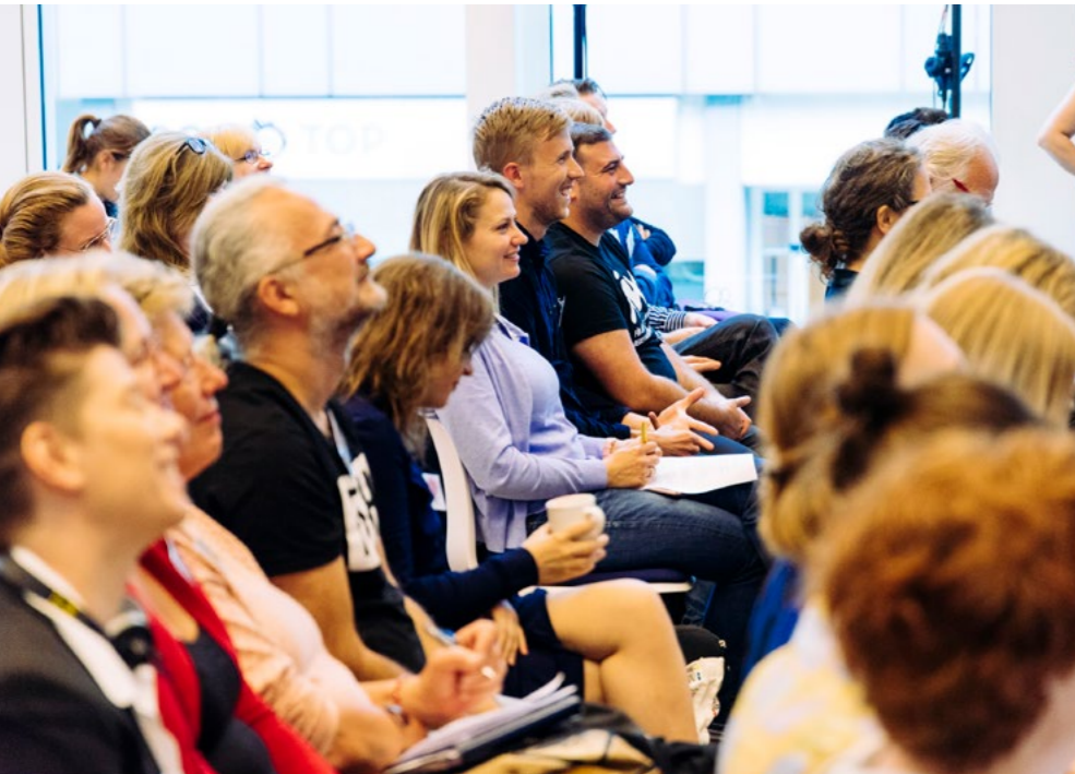
Som samordnare för MenEngage Europa jobbar MÅN aktivt för att främja jämställdhet och förebygga våld i Europa. Under 2016-2018 drev MÅN projektet "IMAGINE – Inspiring Male Action on Gender Equality in Europe".