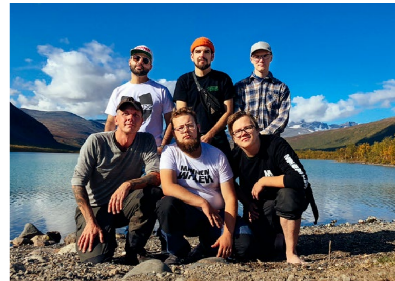
Mannen Myten's projektteam tillsammans med deltagare i den samiska fokusgruppen på fjällvandring i Nikkaloukta.

I MANNEN MYTEN PODCAST NÖRDAR VI NER OSS I MANLIGHET. JUST NU FINNS DET NIO AVSNITT ATT LYSSNA PÅ.