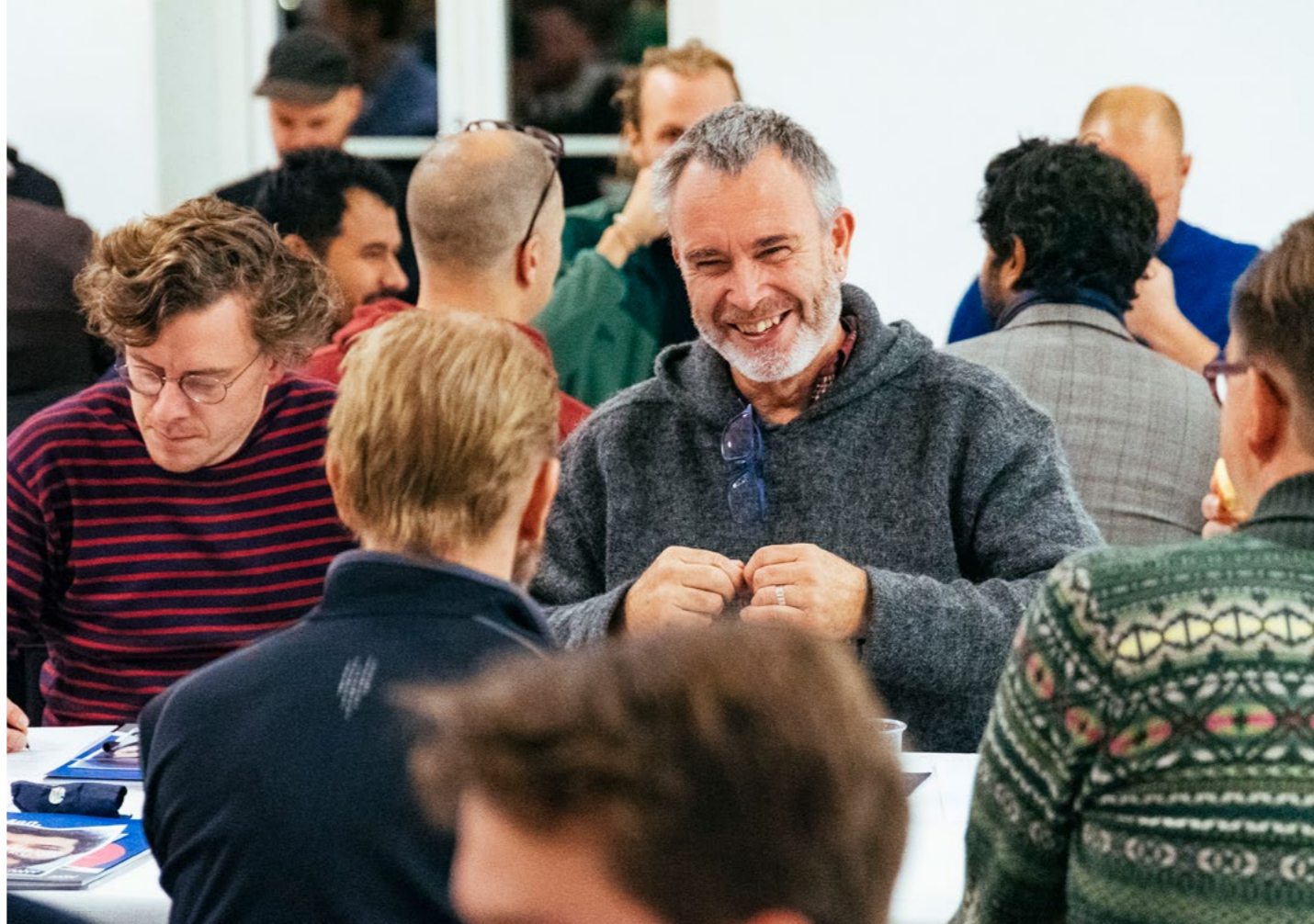
MÄN har lång erfarenhet av att sätta män i rörelse genom samtal. Genom att prata med varandra i trygga rum om erfarenheter, känslor och viljan att förändra så bygger vi en plattform för att skapa förändring i samhället.

Projektet #Eftermetoo – samtalsgrupper för män, kommer att fortsätta under 2019 med fler stormöten och utbildningar. Många lokalgrupper inom MÄN har också uttryckt intresse för att hålla regelbundna stormöten på sina orter. ●