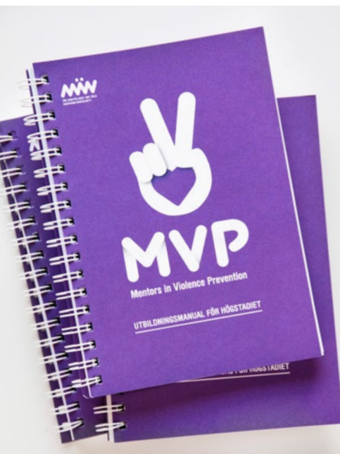
Våra nya MVP-manualer har redan tryckts i 3300 exemplar som skickats ut till skolor över hela Sverige.

MVP är vår manualbaserade utbildning för elever i grundskolan och gymnasiet. Under 2018 spred vi MVP till ännu fler kommuner och skolor, gjorde en ny version av manualen och fick fint besök av MVP:s grundare.